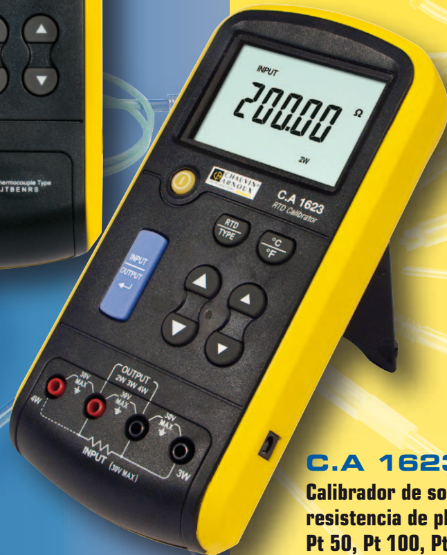
C.A 1623 Calibrador de sondas de resistencia de platino Pt 10, Pt 50, Pt 100, Pt 200, Pt 500, Pt 1000, Pt 100 (JIS)