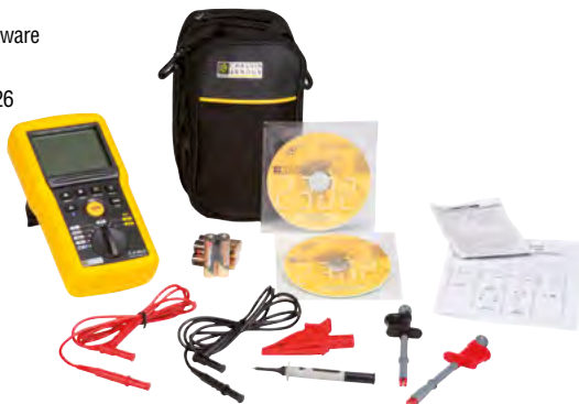
Ejemplo del C.A 6532

C.A 6536, ídem C.A 6524 + 2 sujetacables (rojo y negro).